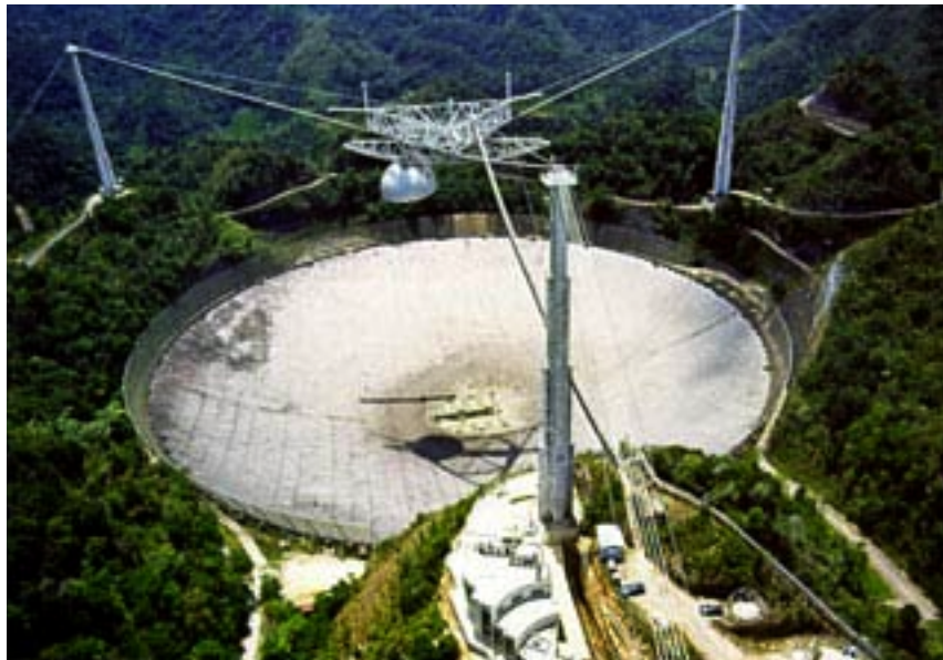
Fig. 2: Il grande radiotelescopio di Arecibo, punto di riferimento di molte ricerche SETI.

delle radioonde sono notevoli: il segnale si propaga alla massima velocità possibile (quella della luce) e l'energia può essere concentrata, utilizzando antenne sufficientemente direttive, in aree relativamente piccole senza dispersione significativa verso direzioni indesiderate. Si ha inoltre il grande vantaggio di poter utilizzare, almeno inizialmente, gli stessi strumenti utilizzati per le ricerche radioastronomiche.