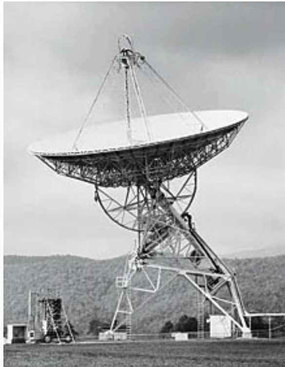
Fig. 1: Radiotelescopio di Greenbank utilizzato da Drake per il progetto Ozma.

che sono immediatamente reperibili, come ad esempio una quantità considerevole di radioenergia emessa per usi interni ben osservabile alle lunghezze d'onda millimetriche.